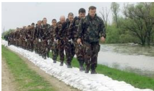
2. kép Katonák a töltésen 2

A védekezés utáni értékelések egyetértenek abban, hogy a Magyar Honvédség igénybevétele, különleges eszközparkja és felkészültsége, szervezettsége, fegyelme és munkabíró képessége miatt elengedhetetlen a rendkívüli árvízhelyzetekben végzett védekezések során. Egyöntetű vélemények szerint mind az irányítás terén, mind az együttműködés, valamint a végrehajtás terén jól bizonyított a védelmi igazgatás kialakított rendszere és a Honvédelmi Katasztrófavédelmi Rendszer. [6]