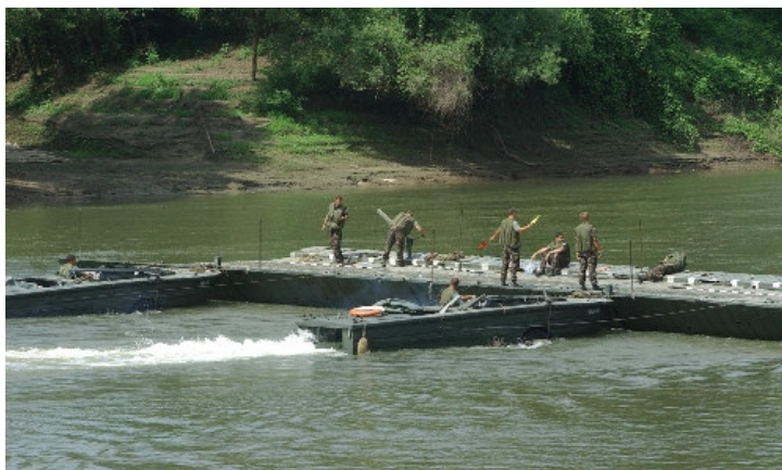
3. kép Műszaki katonák a Tiszán 3

A minőségi mutatókat erősíti a Tisza Többnemzeti Műszaki Zászlóalj létrehozása és fenntartása is. A tiszai árvizek által veszélyeztetett országok (Magyarország, Ukrajna, Szlovákia, Románia) összefogását mutató katonai szervezet létrehozása messze túlmutat a katasztrófák elleni védekezésen, bizonyítva azt, hogy a közös értékek megóvása fontosabb, mint az érdekek túlzott hangsúlyozása. A zászlóalj létrehozásáról szóló megállapodást a négy ország honvédelmi miniszterei 2002. január 18-án írták alá. A mintegy 650 fős közös zászlóalj alaprendelvénye a Tisza vízgyűjtő területén bekövetkezett árvizek, illetve más természeti csapások, ökológiai katasztrófahelyzetek esetén az érintett lakosság megsegítése, a károk elhárításában való részvétel. A négy műszaki századból álló ideiglenes katonai szervezet törzse évente tart vezetési gyakorlatot. A szervezet és az eszközrendszer úgy lett kialakítva, hogy egy árvédekezés során képesek legyenek a hatékony beavatkozásra, életek mentésére, a töltések megerősítésére (3. kép). A zászlóalj parancsnoki posztján egymást váltják a résztvevő országok alegységeinek vezetői úgy, hogy a bevetések során mindig az az ország adja a parancsnokot, amelynek a területén tevékenykednek.