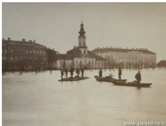
1. kép A szegedi árvíz 1879 1

A következő évtizedek is tartogattak hasonló feladatokat katonáinknak. Igénybe vették szaktudásukat árvízi mentésben, jégtorlaszok robbantásában egyaránt. A két világháború közötti időszak minőségi változást hozott az igénybevétel kérdésében. Az árvízvédelemben való részvételre tervek készültek, amelyekben szabályozták az igénybevétel elvi és gyakorlati kérdéseit. Eszerint: „Katonai segítség, mint árvízi segítőerő, csak fenyegető veszélykor és csak a feltétlenül égető szükségesség tartalmára vehető igénybe. A katonai segítőszolgálat szervezésének célja az, hogy a polgári és katonai vezetőközegek összműködését szabályozza azon esetre, ha árvízvédelem esetén katonai segítőerőt veszünk igénybe. Ezen összműködés pedig azt célozza egyrészt, hogy ennek a segítőerőnek gyors és célszerű alkalmazása biztosítva legyen, másrészt, hogy a katonai segítséget csak olyan számarányban és összetételben vegyék igénybe, ami a tényleges szükségletnek megfelel. A veszedelem megszűntével a katonai segítséget azonnal be kell vonni.”[2]